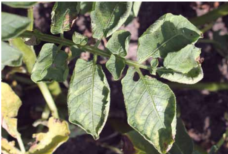
Objawy bakteriozy pierścieniowej ziemniaka na liściu. Charakterystyczne wędnięcie brzegów liści i przebarwienia pomiędzy wiązkami przewodzącymi.

Z początkiem 2014 roku w krajach członkowskich Unii Europejskiej zgodnie z dyrektywą Parlamentu Europejskiego i Rady 2009/128/WE z dnia 21 października 2009 r. oraz rozporządzenia (WE) nr 1107/2009, wszedł w życie obowiązek wprowadzenia zasad Integrowanej Ochrony Roślin, w tym także ziemniaka. Integrowana Ochrona Roślin oznacza w praktyce kombinację zabiegów uprawowych, biologicznych, chemicznych i hodowlanych utrzymujących występowanie agrofagów poniżej progów ich ekonomicznej szkodliwości. Wymogi Integrowanej Ochrony Roślin są podstawą certyfikowanego systemu gospodarowania zwanego Integrowaną Produkcją, której celem jest wytworzenie wysokiej jakości, bezpiecznych dla zdrowia ludzi produktów spożywczych oraz zapewniającej konkurencyjność na rynku i ułatwiającej sprzedaż różnych płodów rolnych. Integrowana Produkcja jest połączeniem Integrowanej Ochrony Roślin, Dobrej Praktyki Rolniczej (zgodny z prawami przyrody sposób gospodarowania) oraz Postępu Biologicznego (wprowadzenia do uprawy gatunków i ich odmian o wysokiej odporności na choroby i szkodniki oraz stresy środowiskowe).