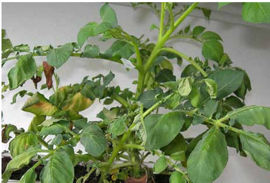
Roślina ziemniaka porażona przez Clavibacter michiganensis ssp. sepedonicus . Objawy bakteriozy na roślinie inokulowanej Cms w warunkach laboratoryjnych.